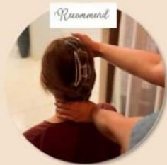
นวดศีรษะ Thai herbs massage and hair care ผ่อนคลายบำรุงผมและหนังศีรษะ