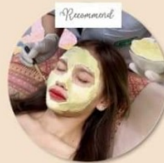
มาสก์หน้าใส Facial mask มาสก์หน้าเพิ่มความกระจ่างใส หลีกสูตรแพทย์แผนจีน