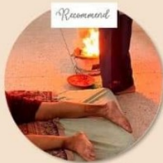
นวดเหยียบเหล็กแดง Yeap Lek Daeng massage for therapy การรักษาอาการปวดตึงของกล้ามเนื้อ และเส้นเอ็น โดยความร้อนจากไฟ